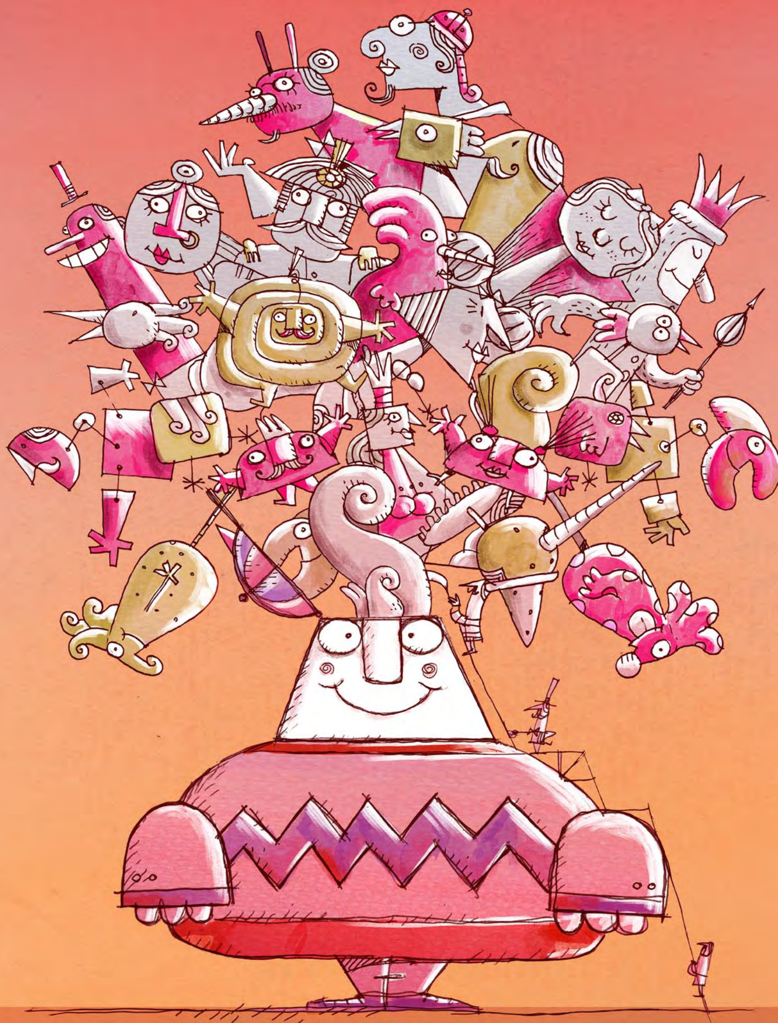
ILLUSTRAZIONE DI SERGIO OLIVOTTI